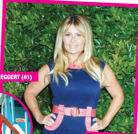
NICOLE EGGERT (41)

Hyaluron-Unterspritzungen und Silikonimplantate für volle Lippen sind bereits ein alter Hut in der Promiwelt. Auch bei Britney Spears. Sie verwendet zusätzlich eisgekühlte Alufolie, die sie sich auf Lippen legt. So wirken sie kurzfristig extrem voll