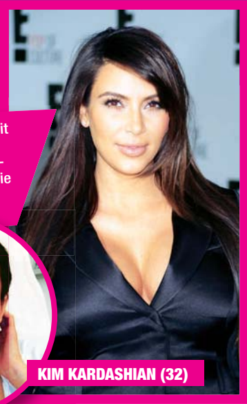
KIM KARDASHIAN (32)

Kim machte das „Vampir-Lifting“ mit diesem Twitter-Grusefoto weltweit bekannt. Durch Eigenblutunterspritzung wird die Haut aufgepolstert, die Kollagenbildung angeregt