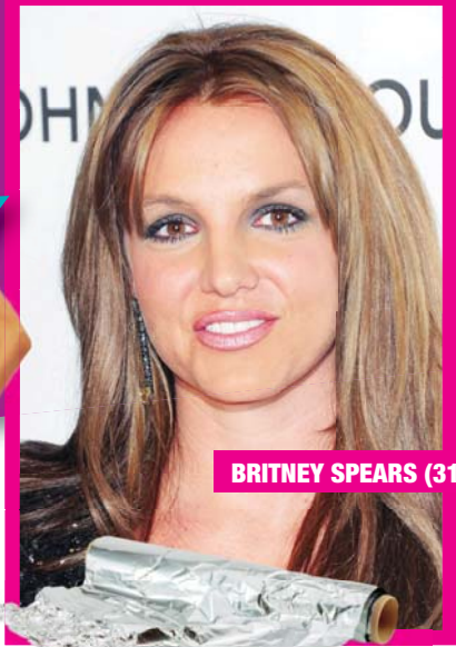
BRITNEY SPEARS (31)

Früher flach, jetzt verdächtig prall. In Hollywood ist es ein offenes Geheimnis, dass Eva Longoria offenbar mit Silikon-Implantaten ihren Po aufgepimpft hat